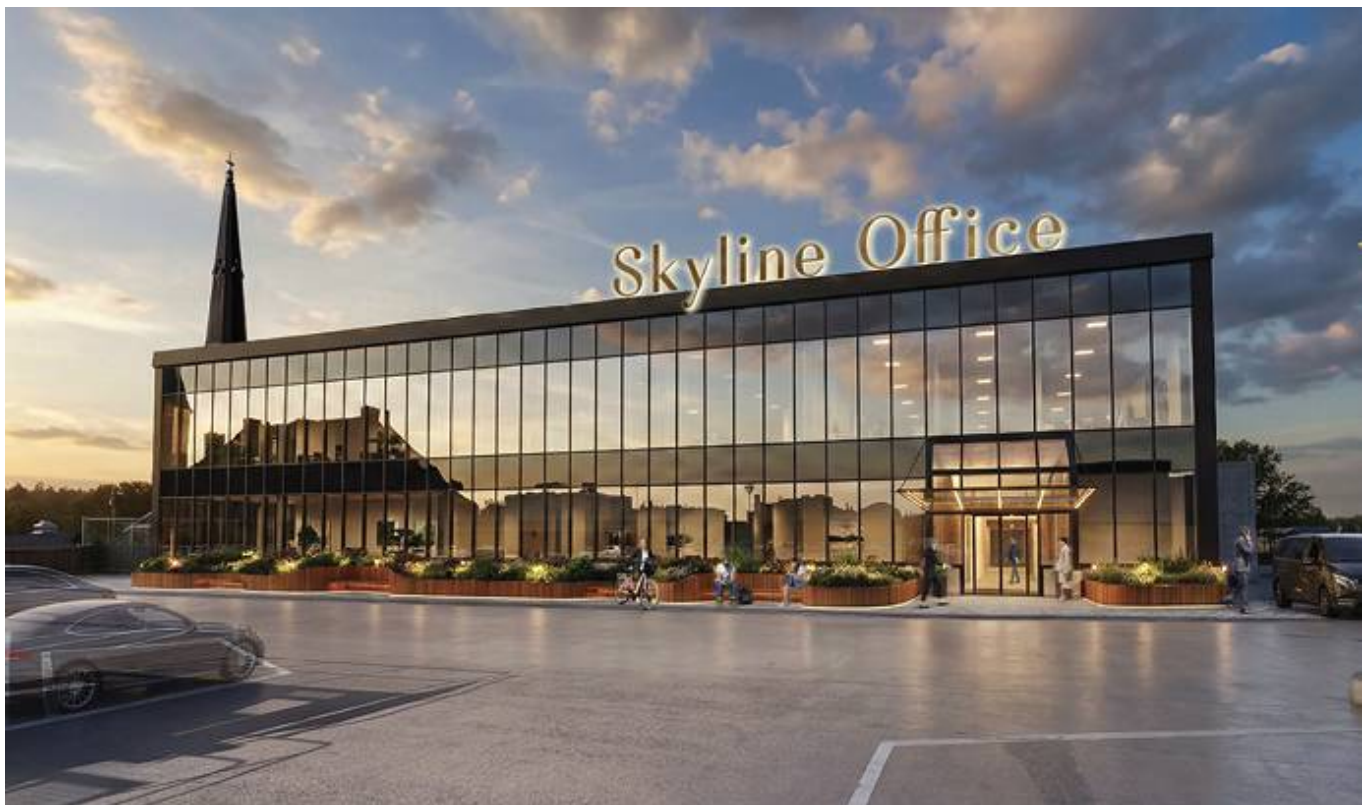
Vasagatan 25, City, Västerås - Kontor