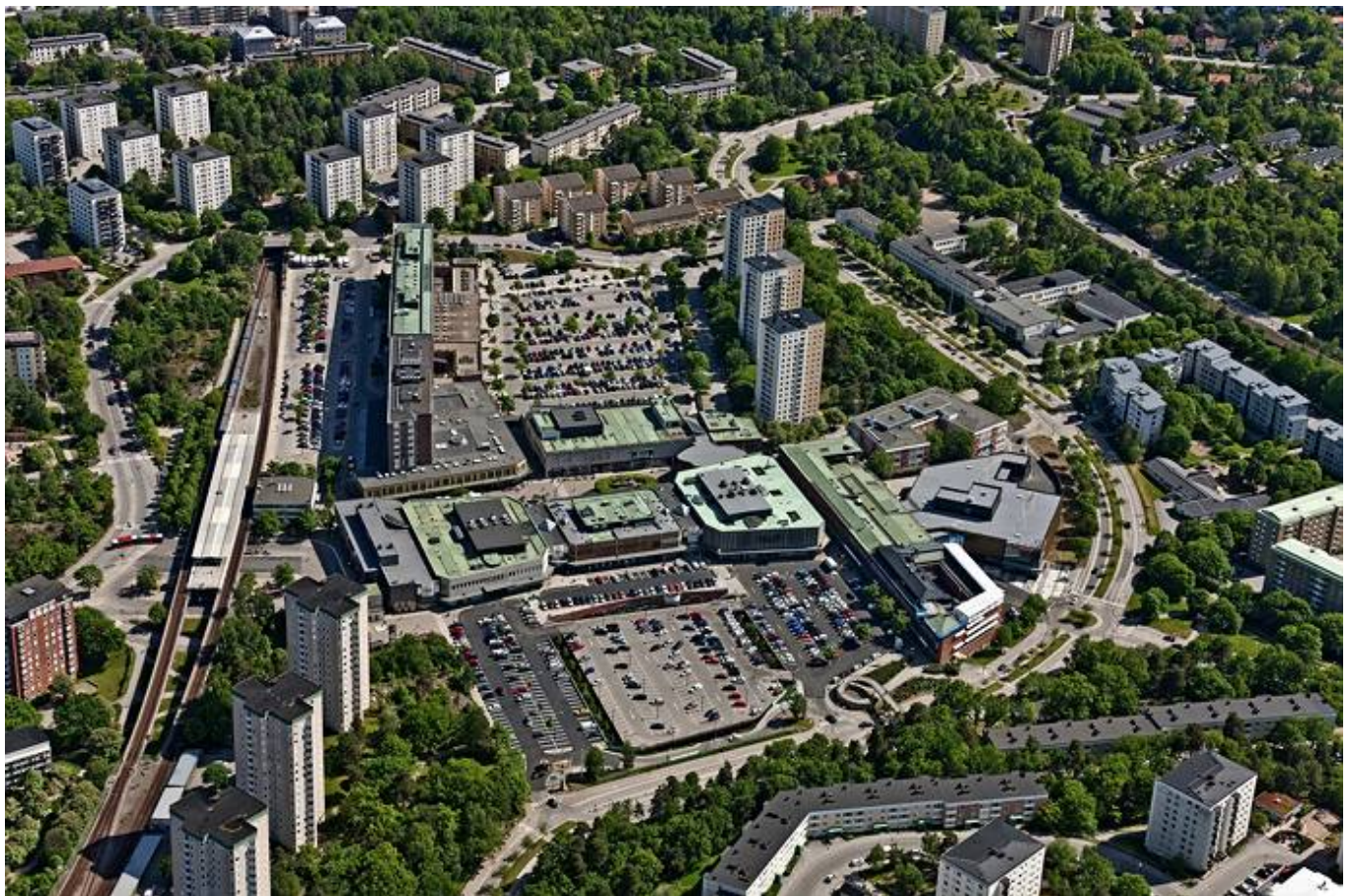
Farstaplan 15, Farsta Centrum, Farsta - Butik