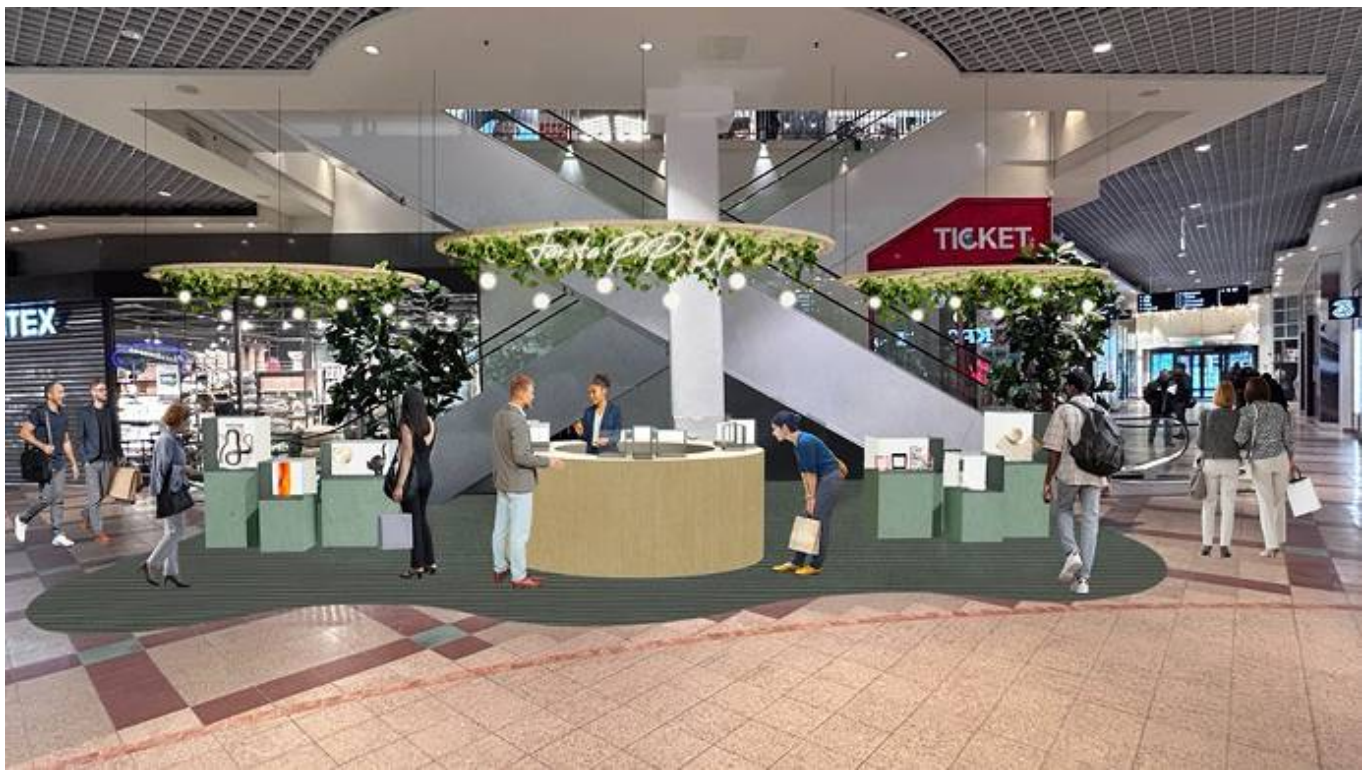
Farstaplan 15, Farsta Centrum, Farsta - Butik