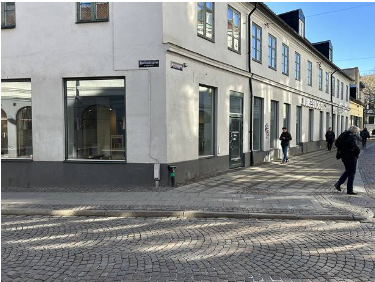
Skomakaregatan 4, Centrala Lund, Lund - Restaurang & café