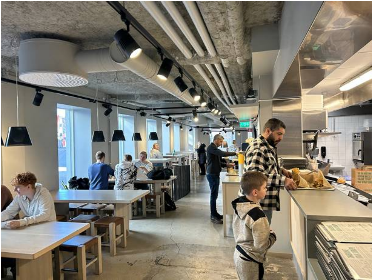
Skomakaregatan 4, Centrala Lund, Lund - Restaurang & café