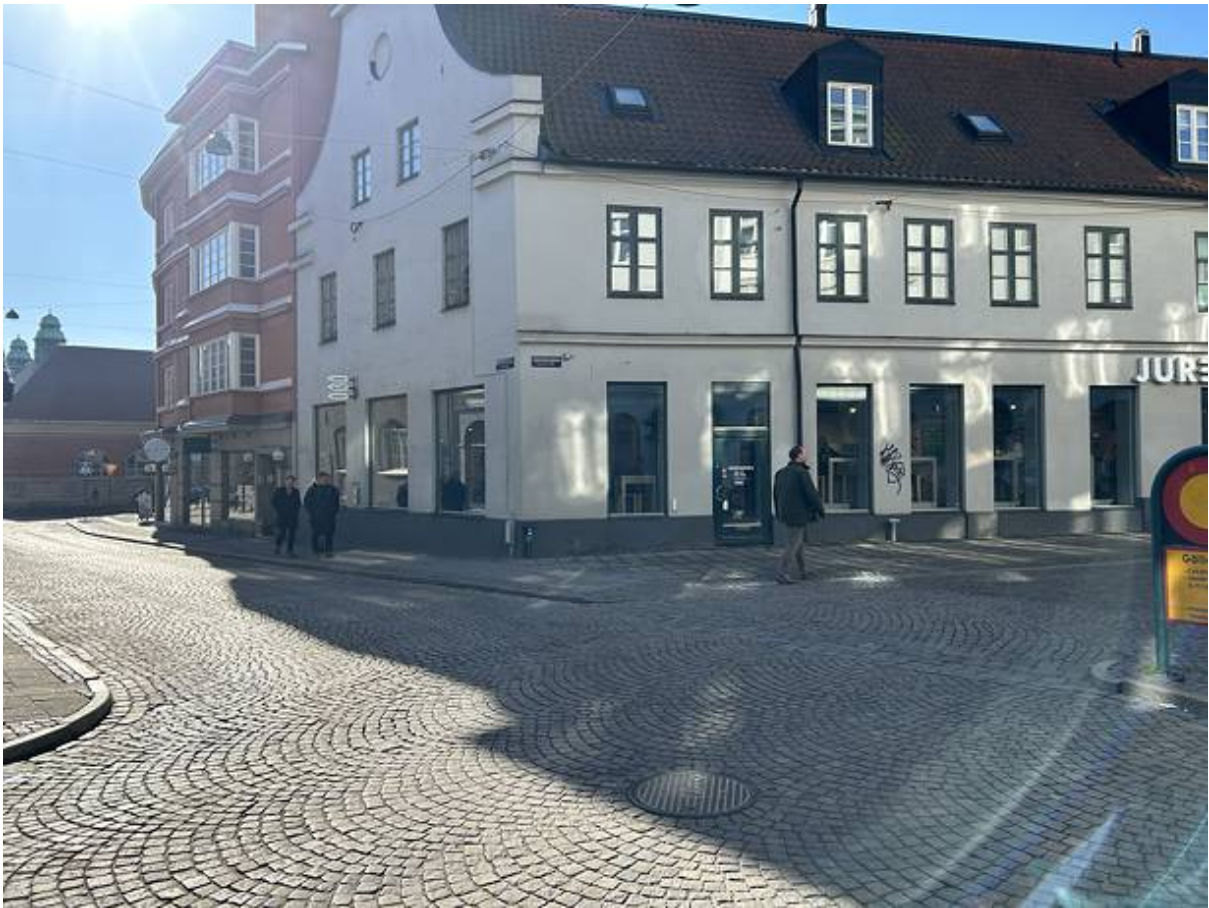
Skomakaregatan 4, Centrala Lund, Lund - Restaurang & café