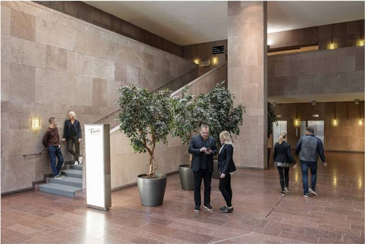
Storforsplan 44, Farsta Centrum, Farsta - Kontor | Skola, vård & omsorg