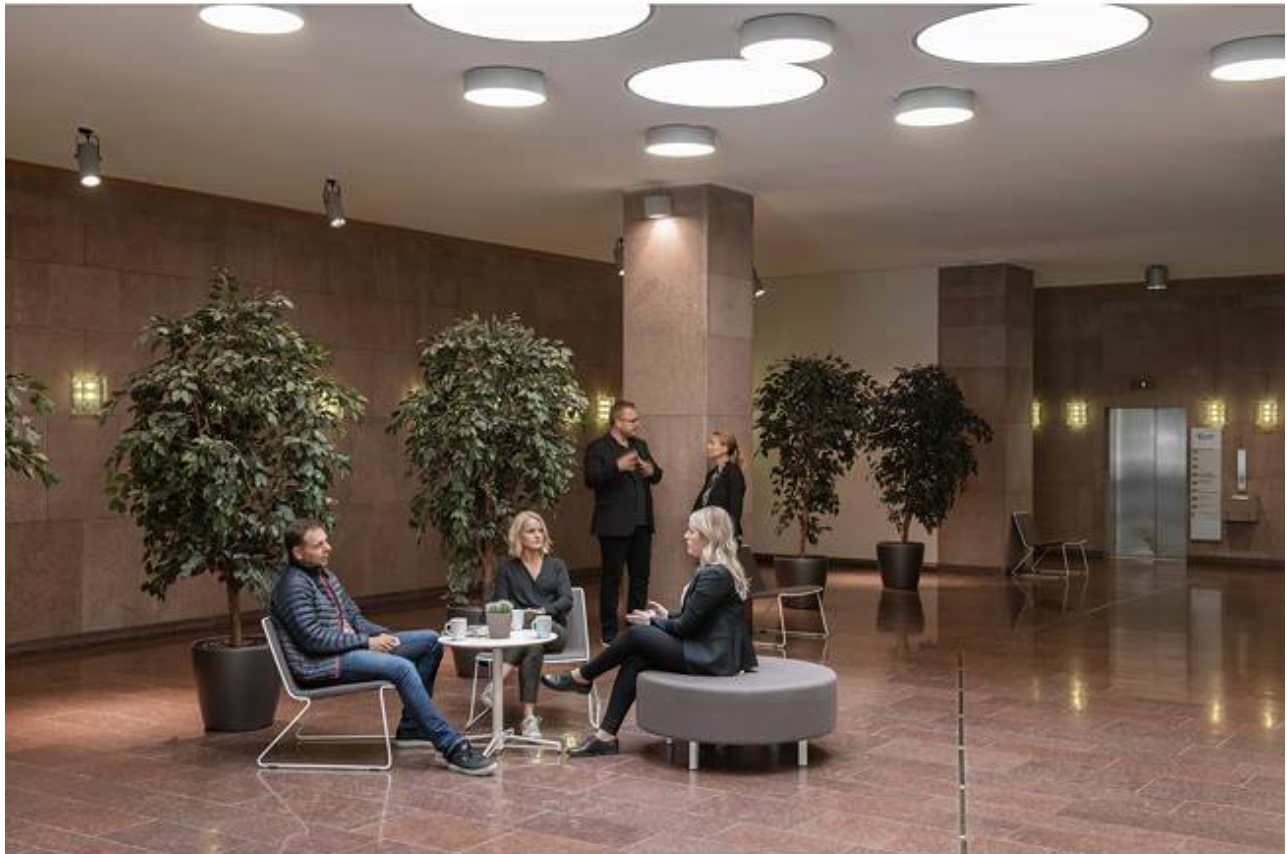
Storforsplan 44, Farsta Centrum, Farsta - Kontor | Skola, vård & omsorg