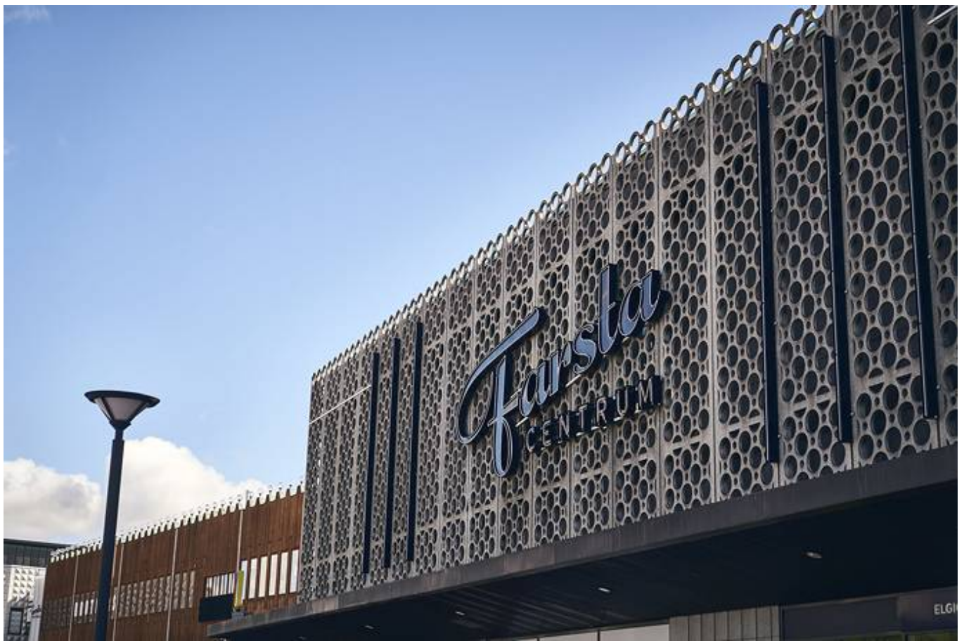
Storforsplan 44, Farsta Centrum, Farsta - Kontor | Skola, vård & omsorg