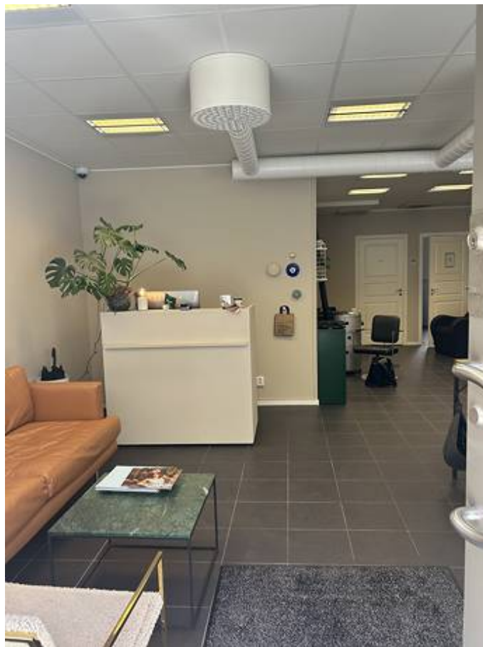
Svartbrödersgatan 2, City, Lund - Butik