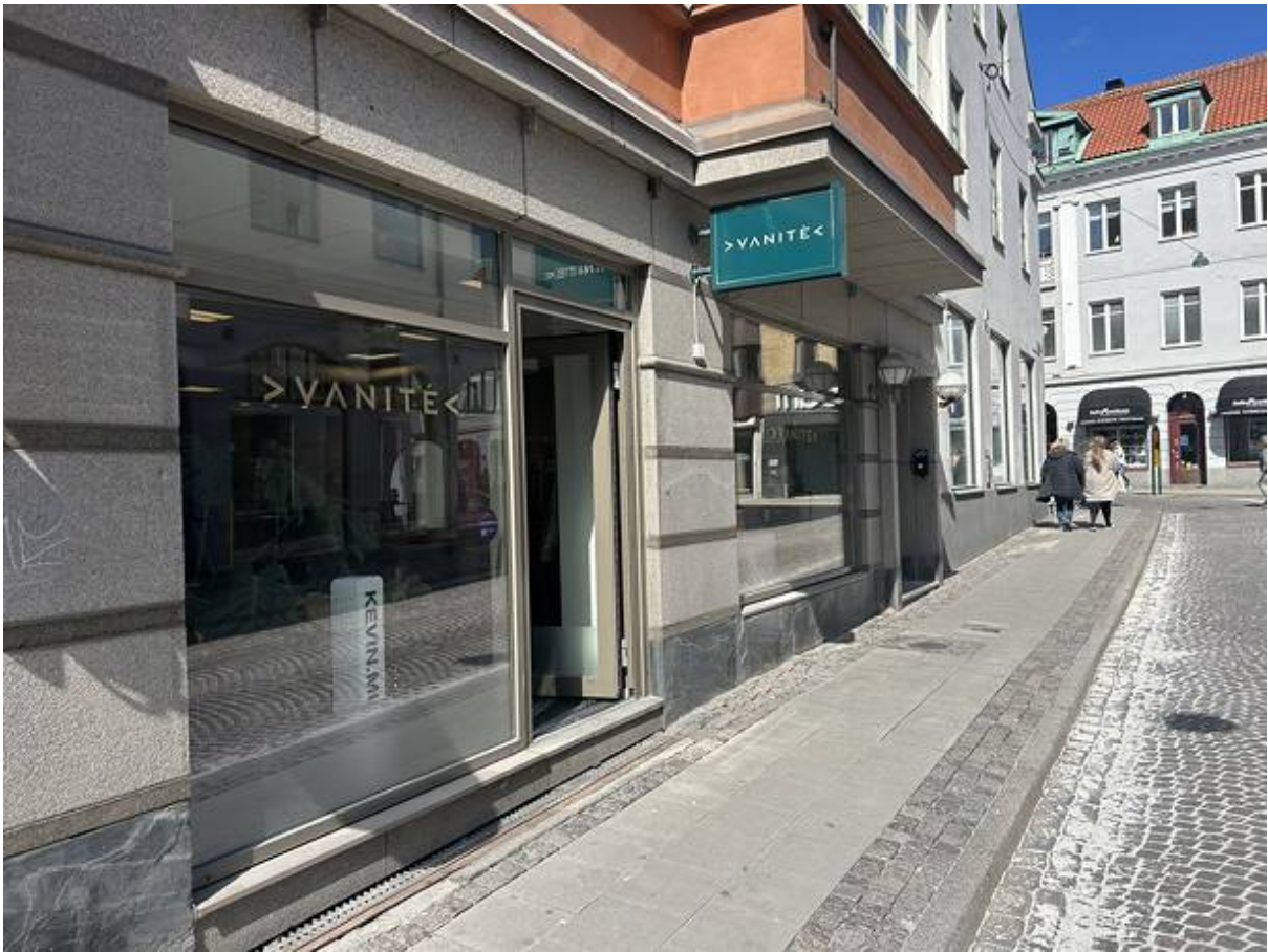
Svartbrödersgatan 2, City, Lund - Butik