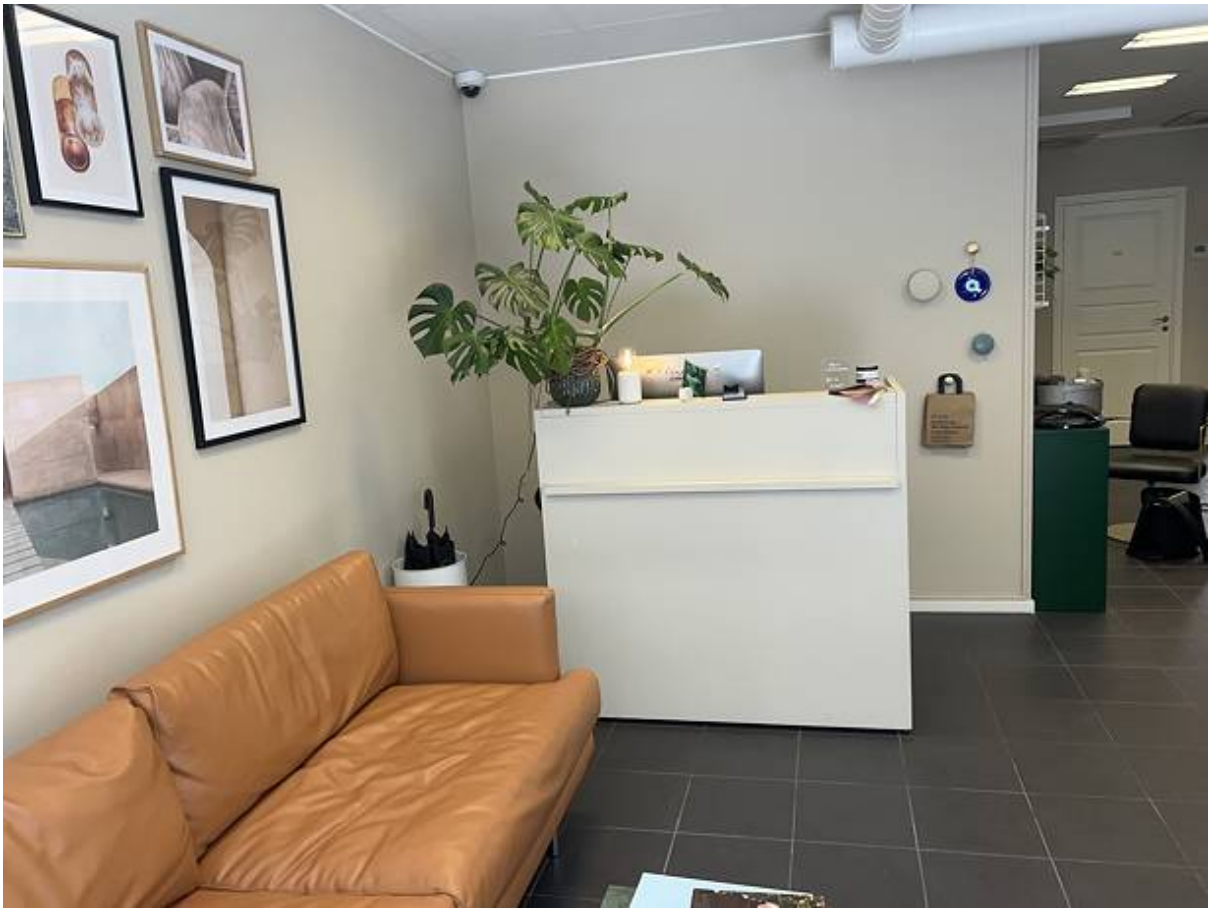
Svartbrödersgatan 2, City, Lund - Butik