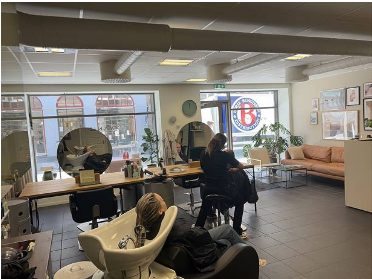
Svartbrödersgatan 2, City, Lund - Butik