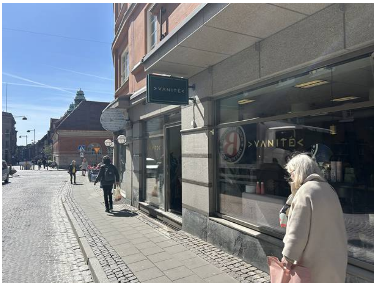
Svartbrödersgatan 2, City, Lund - Butik