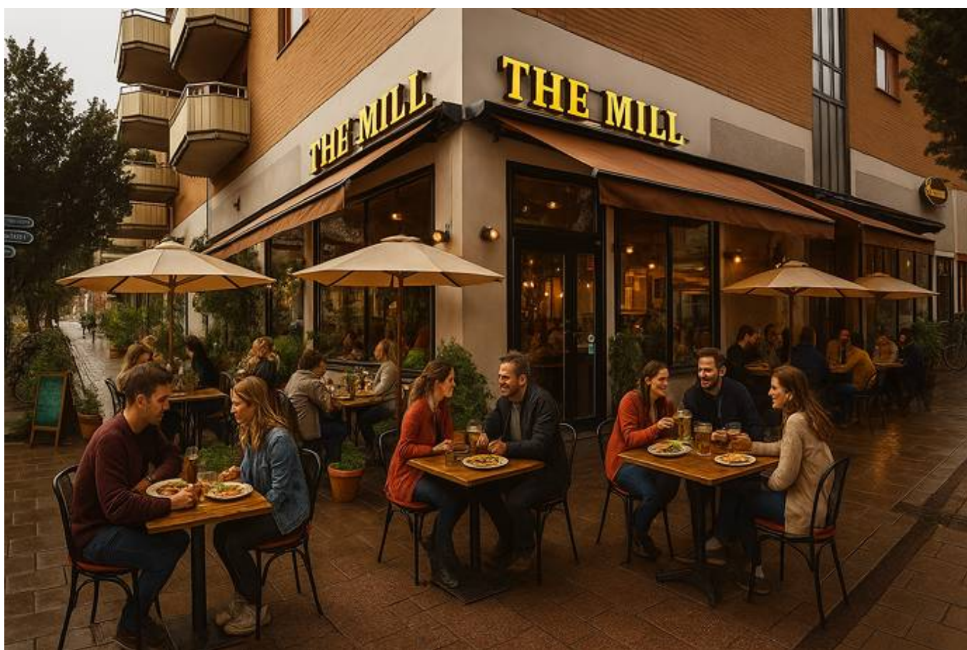
Vaksalagatan 30, Fålhagen, Uppsala - Restaurang & café